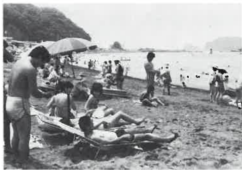
休暇は計画的に有効に