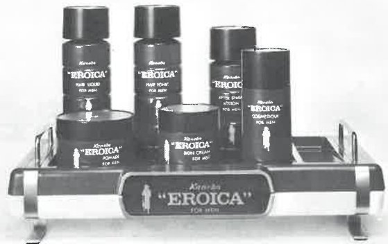
紳士用化粧品エロイカシリーズ

エロイカのあの独特の清涼感とまろやかさ、 心にゆとりを生む気品ある香り。英雄は英雄 を知るとか。エロイカは、あたくのサウナに 一級のお客さまを呼ぶでしょう。