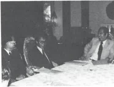
会議後談笑する出席委員